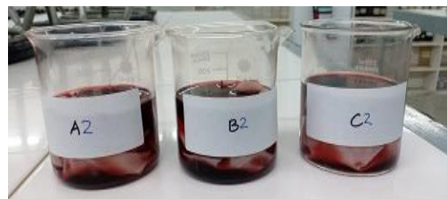
Gambar 1. Proses Pewarnaan alami

dengan pengaturan suhu 50°C dengan waktu yang terkontrol.