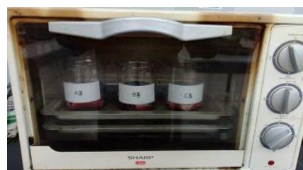
Gambar 2. Proses Pewarnaan dengan oven.

Setelah proses pewarnaan dengan bantuan pemanasan selesai selanjutnya kain dikeringkan dengan menggunakan oven blower , untuk mempersingkat waktu mengeringan dan agar warna dapat terikat dengan baik. Hasil proses pencelupan warna didapatkan warna yang merata dan tercampur dengan baik, hal tersebut memberikan tanda bahwa optimalisasi pewarnaan tercapai dengan baik, bantuan pemanasan memberikan kontribusi yang signifikan dalam proses tersebut.